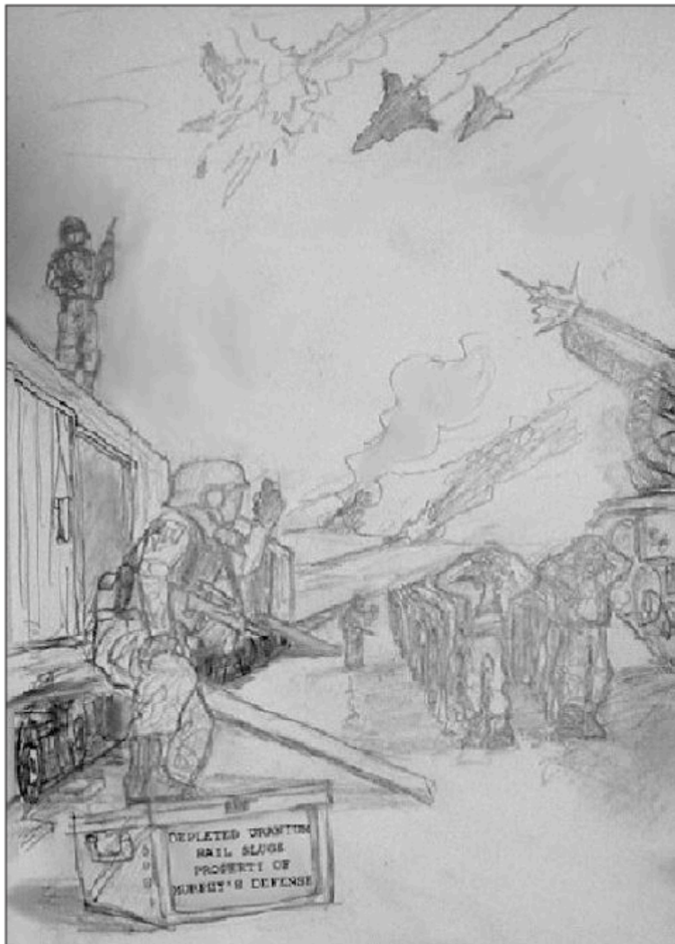
Illustration: Robert Vroman